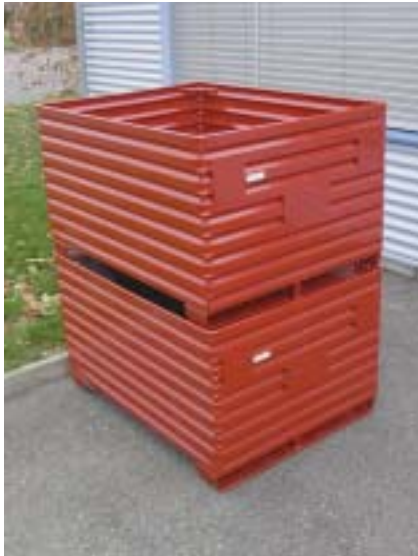
Metallboxe 2360, gestapelt Boite métallique 2360, superposé