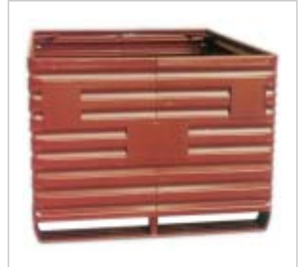
Metallboxe 2360, Grundmass 1600 x 1200 mm Boxe métallique 2360, dimensions 1600 x 1200 mm