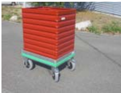
Metallboxe Typ 2310 mit Logistik-Roller Boite métallique 2310, avec chariot roulant en profil cornière