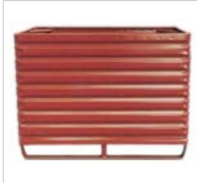
Metallboxe 2330, Füllhöhe 800 mm Boxe métallique 2330, hauteur de remplissage 800 mm