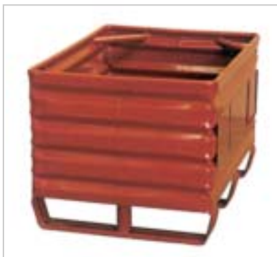
Metallboxe 2302, Füllhöhe 400 mm Boxe métallique 2302, hauteur de remplissage 400 mm

Fettgedruckte Grössen sind Normausführungen. Dimensions normalisées imprimées en gras.