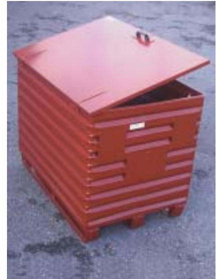
Metallboxe Typ 2330 mit scharniertem Deckel Boite métallique 2330, avec couvercle avec charnière