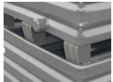
Boxen dicht geschweisst mit Auslaufstutzen, Füße verstärkt mit Knotenblechen Boxes soudées étanches avec bouchon de vidange et pieds renforcés