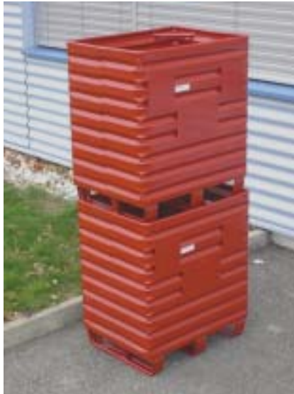
Metallboxe Typ 2310 gestapelt Boite métallique 2310, superposé