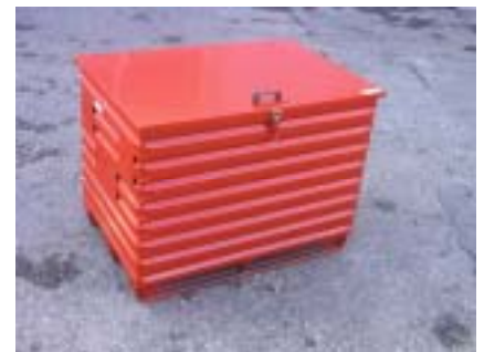
Metallboxe Typ 2330 mit abschließbarem Deckel Boite métallique 2330, avec couvercle verrouillable