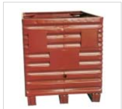
Metallboxe 2330, Frontansicht Boxe métallique 2330, vue frontale