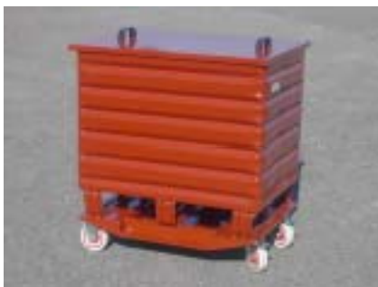
Metallboxe mit Auflegedeckel, unterfahrbar mit Handhubwagen Boite métallique avec couvercle libre, manutention à l'aide de grues, de palans, de transpalettes