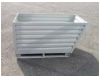
Kippmulde mit verstärkten Füßen Bac verseur avec pieds renforcés